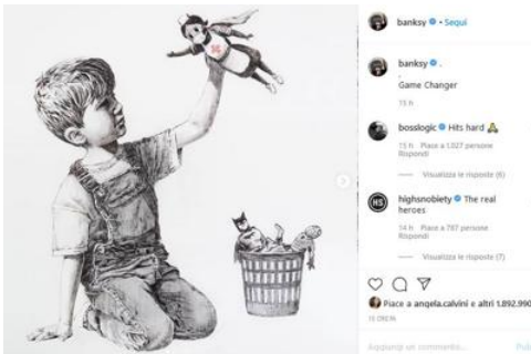
Coronavirus: nella nuova opera di Banksy l'infermiera è ...