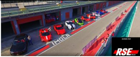
La ricetta di Rse Italia per combattere il Covid 19 Co ...