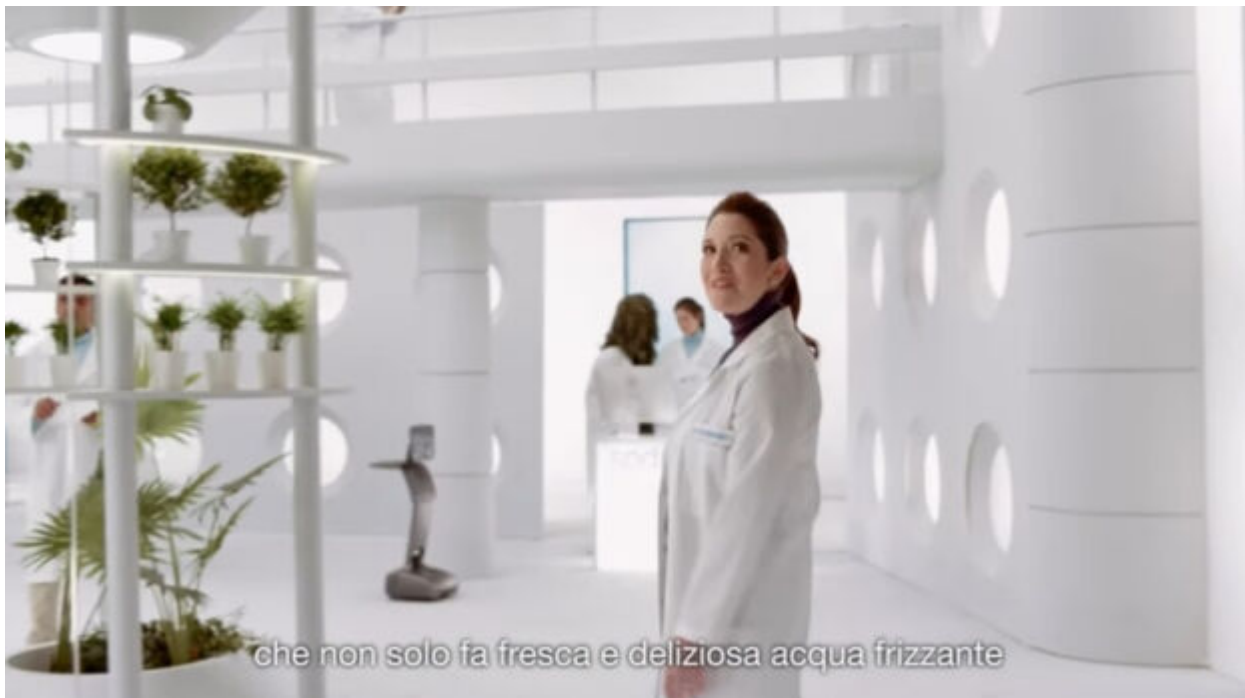
SodaStream con Randi Zuckerberg: Frame dello spot della campagna.

La protagonista dello spot, inoltre, invita gli utenti a raggiungere il sito web di SodaStream e in particolar modo la pagina dedicata alla Giornata mondiale della Terra per ricevere consigli utili per rendere la propria quotidianità eco-friendly.