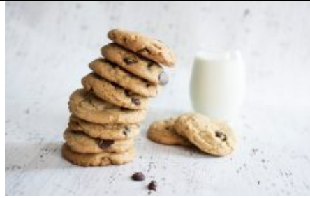
5 golose novità fit food per addolcire l'autunno