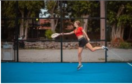
Fruitbar, frutta secca ed essiccata per lo spuntino degli sportivi