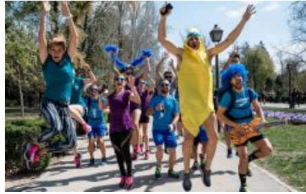
Brooks Run Happy Team 2020, aperte le candidature