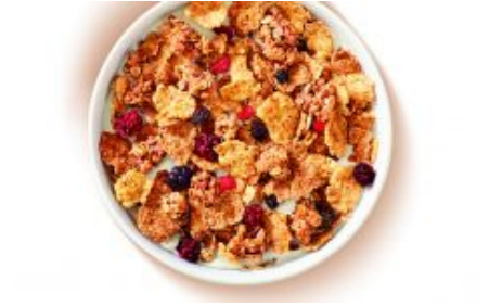
La colazione giusta per i fitness lovers

Copyright ©2016, MyFitnessMagazine. All Rights Reserved.