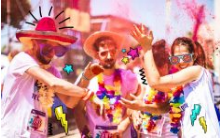
A Riccione si corre The Color Run con Sojasun